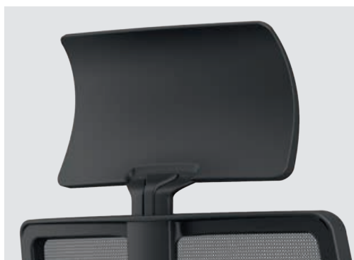
• Fix comfortable headrest